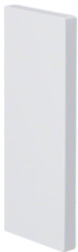
BRP Końcówka 65x170, biały