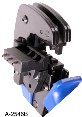
A-2546B "Szczegół" z zamontowanym pozycjonerem