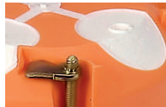
Membrana przebiciowa do rur, peszli i przewodów